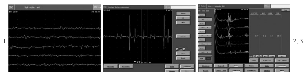
Fig. 1. – EMG dello sfintere anale esterno a riposo: presenza di attività tonica. Fig. 2. – EMG del bulbocavernoso in contrazione volontaria. Fig. 3. – Riflesso bulbocavernoso (RBC).

L'attività afferente che origina dalla vescica e dall'uretra e dallo sfintere anale è trasmessa attraverso fibre mieliniche di piccolo diametro A-delta e dalle amieliniche C, che forniscono informazioni su tensione, volume e sensibilità dolorosa attraverso le radici dorsali assieme ai nervi somatici, parasimpatici e simpatici.